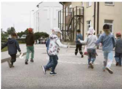
Bērnu laimīgums no video

REKLĀMA 9:42, 18. septembris 2018 0 Komentāri