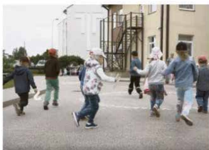
Bērnu zīmējums no video

REKLĀMA 9:42, 18. septembris 2018 0 Komentāri